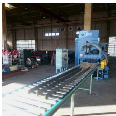
ショットブラスト(表面処理)